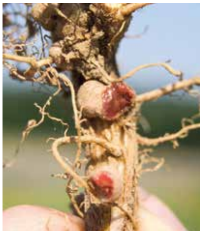
Wurzel einer mit RhizoFix® geimpften Sojabohne

Leguminosen gehen mit artenspezifischen Rhizobien (Knöllchenbakterien) eine Symbiose ein. Über die Knöllchen sind die Leguminosen in der Lage, Luftstickstoff zu fixieren. Deshalb können auch nur Leguminosen mit einem ausreichenden Knöllchenbesatz ihre optimale Leistung erreichen. Luftstickstoff stellt mit einem Anteil von 78 % an der Luft ein großes Stickstoffreservoir dar. Allerdings können die meisten Pflanzen Stickstoff nur in mineralischer Form als Ammonium und vor allem Nitrat aufnehmen. Nur Leguminosen können in Symbiose mit Rhizobien den molekularen Luftstickstoff fixieren. Um diese Symbiose zu gewährleisten, ist ein Kontakt zwischen der Wurzel und den Bakterien erforderlich. Um die Rhizobien zu den Wurzeln zu locken, scheiden diese Stoffe aus, welche die Rhizobien zu den Pflanzen führen. Über diese Stoffe erkennen die Bakterien die Pflanzenzellen und es findet eine „Infektion“ der Wurzelzelle statt. Um eine ausreichende